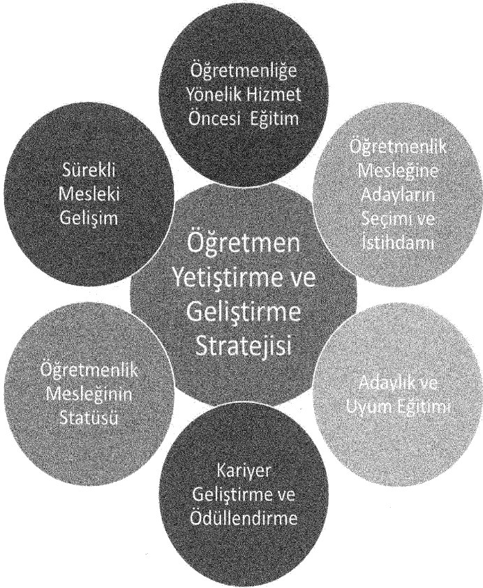
Şekil 1. Öğretmen Strateji Belgesi Ana Temalar

Öğretmen strateji belgesinde öğretmenlik mesleğine yönelik politikaların geliştirilmesi için, gerek öğretmenlik mesleğine ilişkin süreçler gerekse temel sorun alanları göz önünde bulundurularak 6 ana tema belirlenmiştir. Belgede yer alan amaç, hedef ve eylemler Şekil 1'de yer alan ana temalar dikkate alınarak oluşturulmuştur.